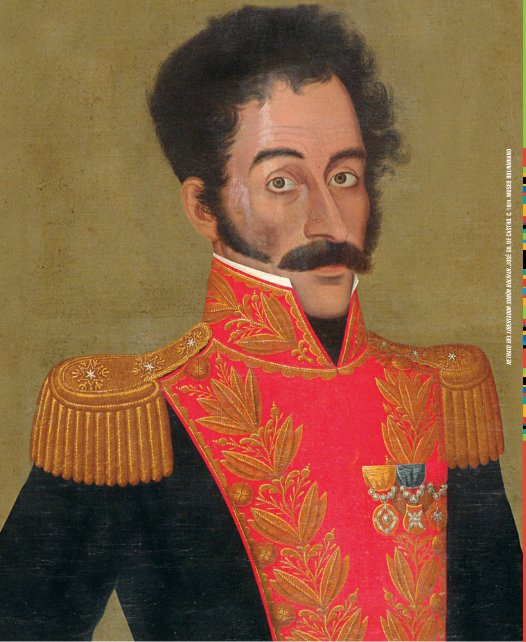
RETRATO DEL LIBERTADOR SIMÓN BOLÍVAR, JOSÉ GIL DE CASTRO, C. 1824. MUSEO BOLIVARIANO

COMISIÓN PRESIDENCIAL PARA LA CONMEMORACIÓN DEL BICENTENARIO